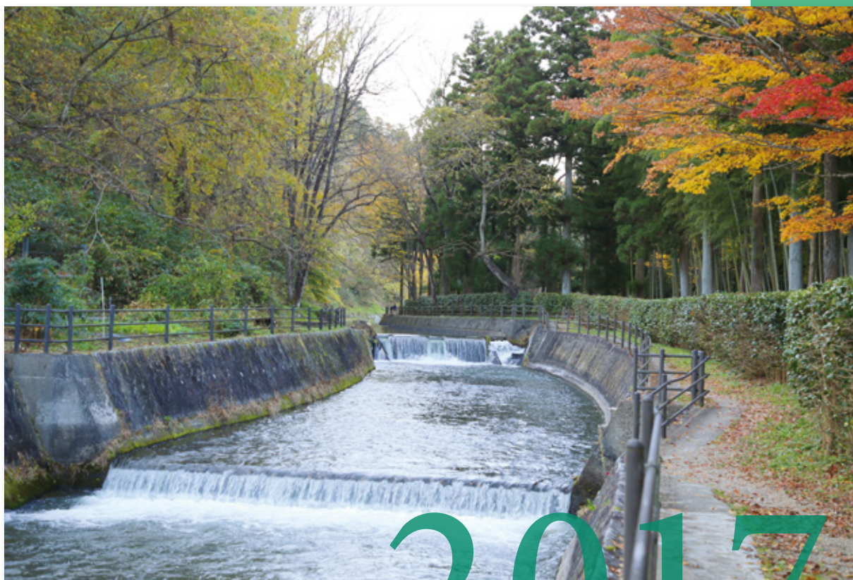
世界かんがい施設遺産「内川」(大崎市岩出山)