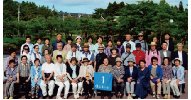
ふるしん旅行会 2016.7.7 トラビスタ又修道院

本店・信栄会、古川駅前支店・信和会、三日町支店・三信会の3店合同企画旅行として、平成28年7月7日・8日、1泊2日の日程で北海道新幹線開業記念「新幹線で行く函館周遊2日間」を開催いたしました。