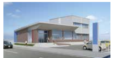
「泉中央支店」完成予想図

「泉中央支店」は平成28年5月の開設に向け、平成27年9月11日店舗新築工事を開始しました。